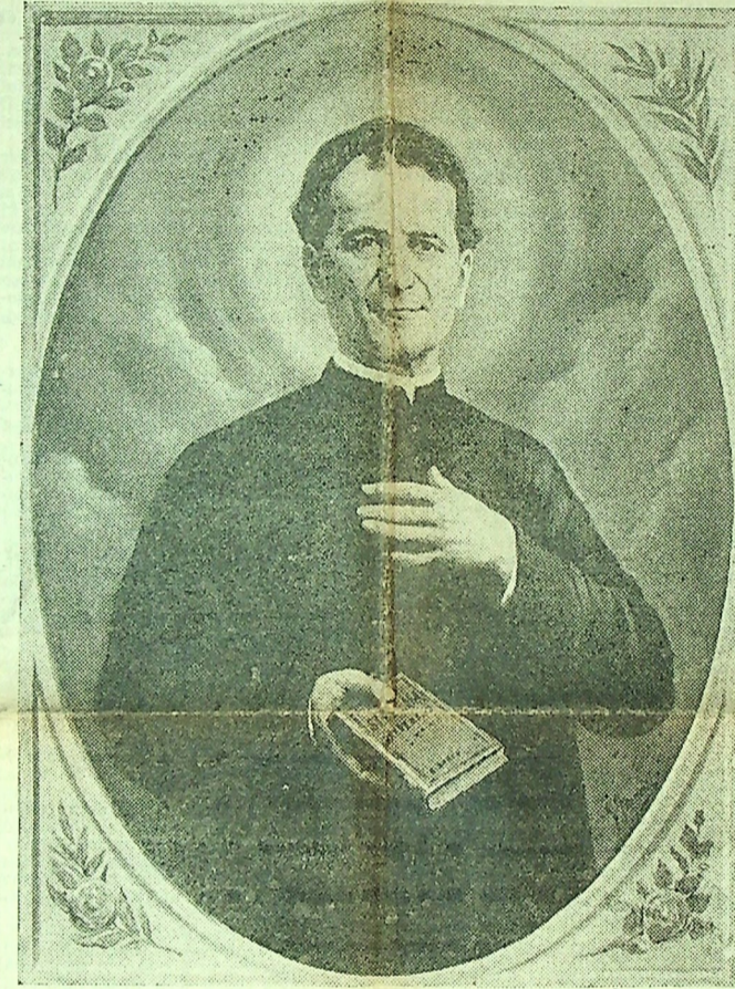
Il Venerabile Don Giovanni Bosco

vede quello più vasto che farà in avvenire. Col pensiero e il cuore sempre ricolti al popolo e alla sua cura gioventù specialmente, egli, che aveva anche una bella intelligenza, s'immerge nell'agiografia e nella storia ecclesiastica; pur di continuo in viaggio, pur con una mole di affari alle mani, che gli venivano oltre che dalle proprie istituzioni, da impegni ardui affidatigli dal Papa, dai Vescovi, da uomini di Stato, diventa un formidabile divulgatore, scrive un centinaio di pubblicazioni, crea le Letture Cattoliche, cura le edizioni della letteratura cristiana antica, sollevan-